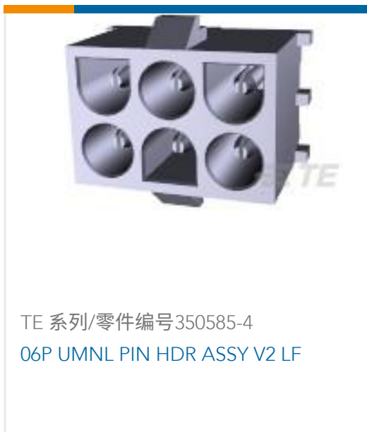
TE 系列/零件编号350585-4 06P UMN L PIN HDR ASSY V2 LF