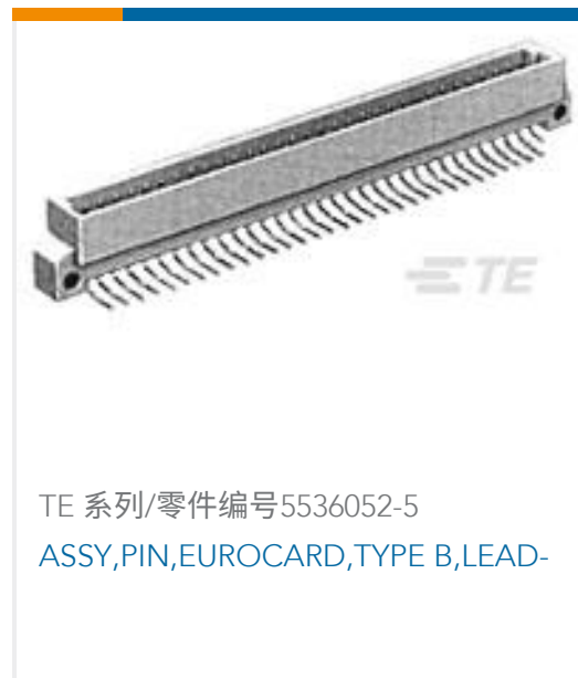
TE 系列/零件编号5536052-5 ASSY,PIN,EUROCARD,TYPE B,LEAD-