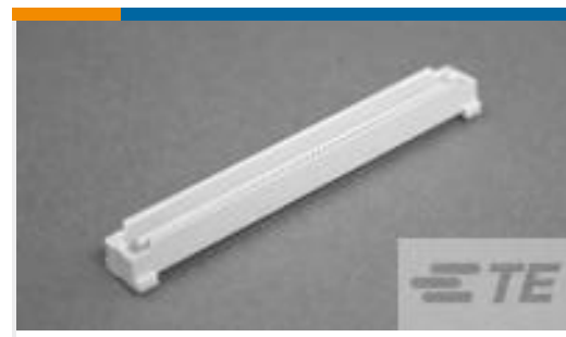
TE 系列/零件编号5177984-2 0.8FH,P05H.5,060,08/Sn,TU