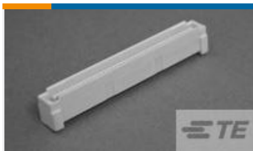
TE 系列/零件编号5179031-2 0.8FH,P08H.5,060,08/Sn,TU