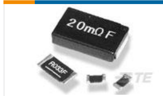
TE 系列/零件编号1625826-3 TL2B R01 1%