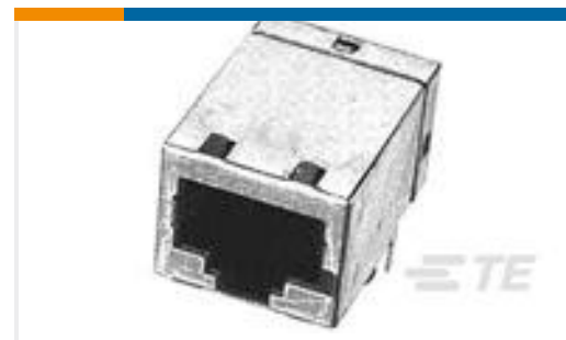
TE 系列/零件编号5569564-1 MJ ASSY,R/A,8 POS,LED GRN&YELW