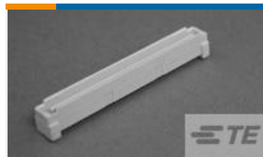
TE 系列/零件编号5179030-2 0.8FH,P07H.5,060,08/Sn,TU