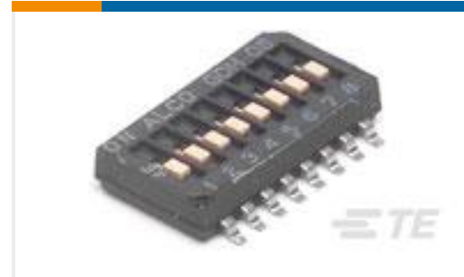
TE 系列/零件编号1571983-1 GDH02S04=DIP SWITCH