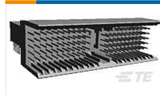
TE 系列/零件编号5106015-1 Z-PACK/A RAMH.110P