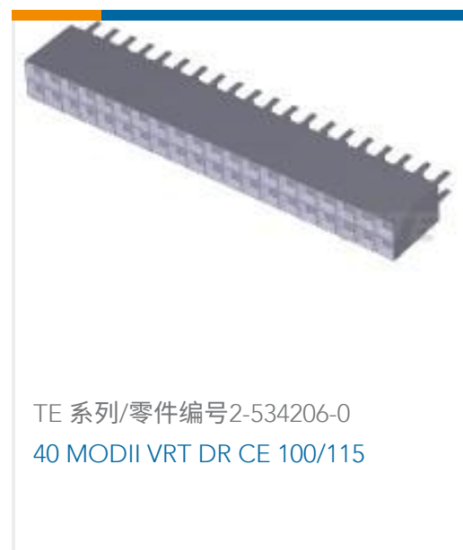
TE 系列/零件编号2-534206-0 40 MODII VRT DR CE 100/115