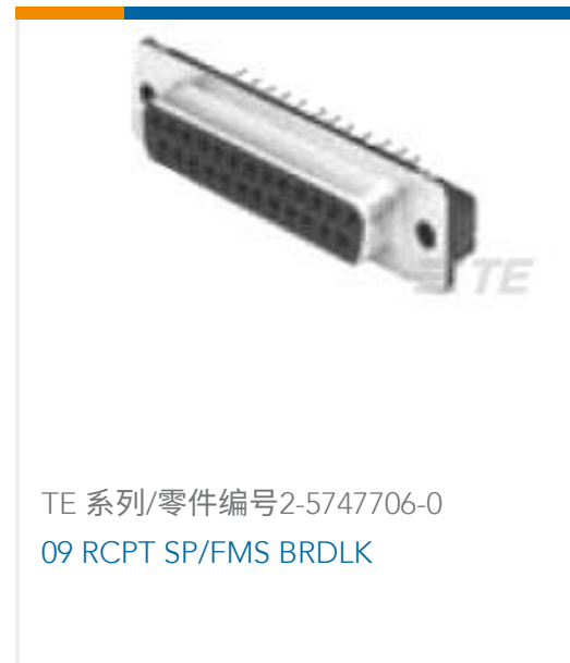
TE 系列/零件编号2-5747706-0 09 RCPT SP/FMS BRDLK