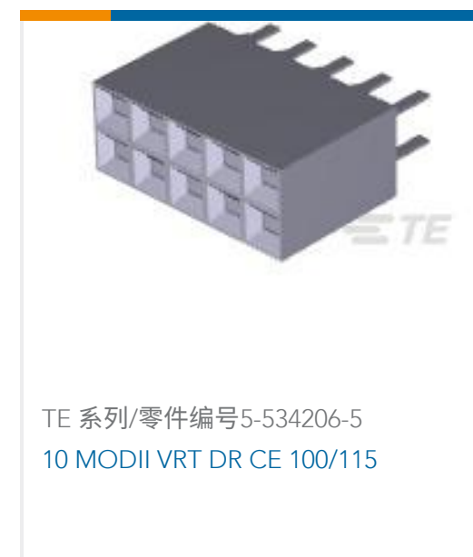
TE 系列/零件编号5-534206-5 10 MODII VRT DR CE 100/115