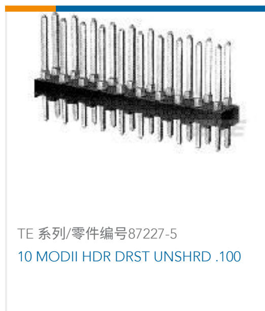
TE 系列/零件编号87227-5 10 MODII HDR DRST UNSHRD .100