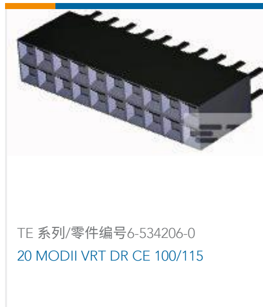
TE 系列/零件编号6-534206-0 20 MODII VRT DR CE 100/115