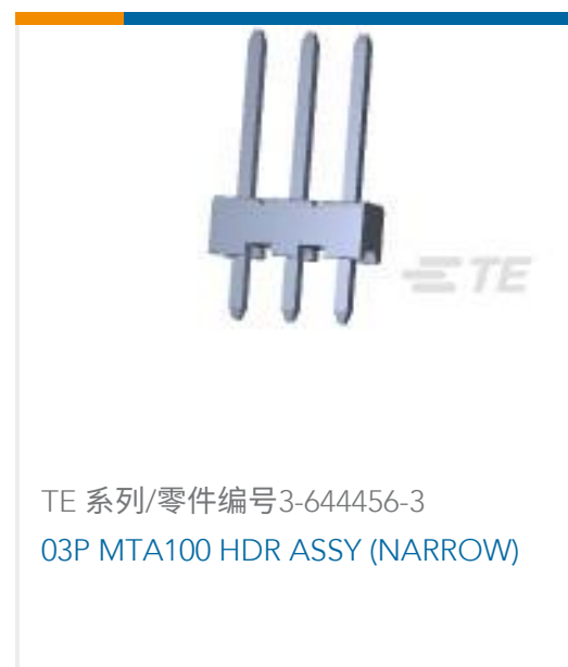
TE 系列/零件编号3-644456-3 03P MTA100 HDR ASSY (NARROW)