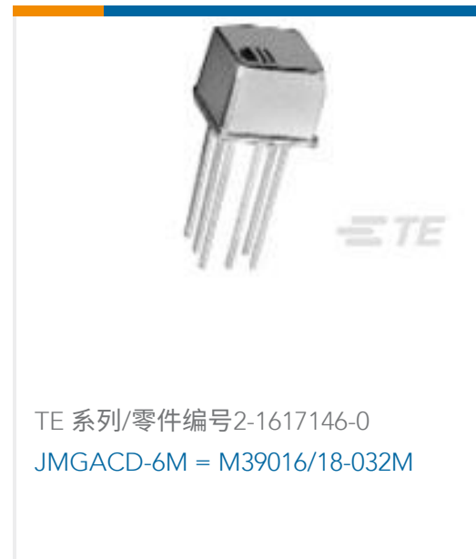
TE 系列/零件编号2-1617146-0 JMGACD-6M = M39016/18-032M