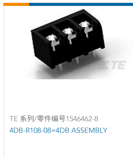
TE 系列/零件编号1546462-8 4DB-R108-08=4DB ASSEMBLY