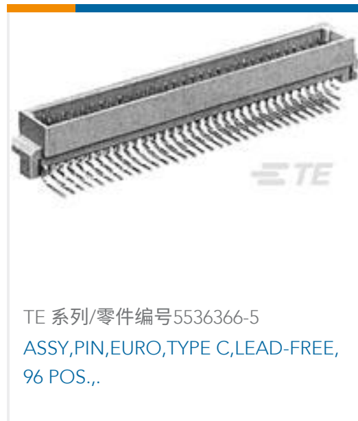
TE 系列/零件编号5536366-5 ASSY,PIN,EURO,TYPE C,LEAD-FREE, 96 POS.,.