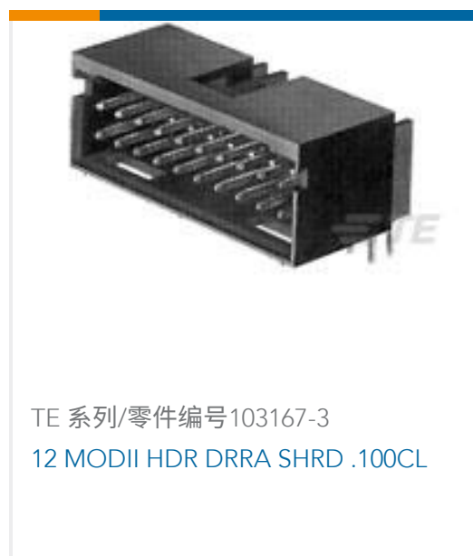
TE 系列/零件编号103167-3 12 MODII HDR DRRA SHRD .100CL