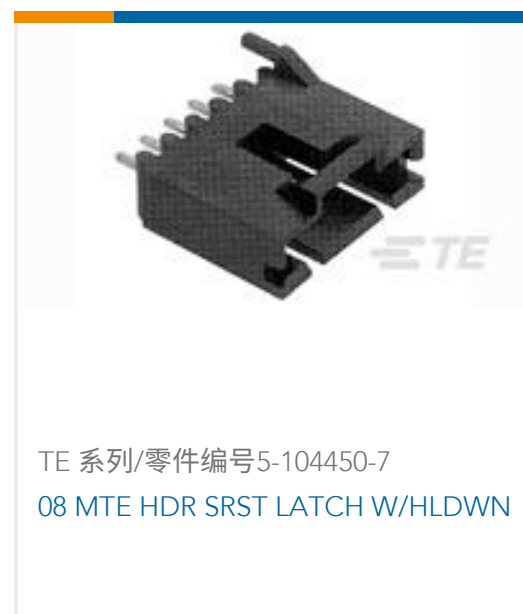
TE 系列/零件编号5-104450-7 08 MTE HDR SRST LATCH W/HLDWN