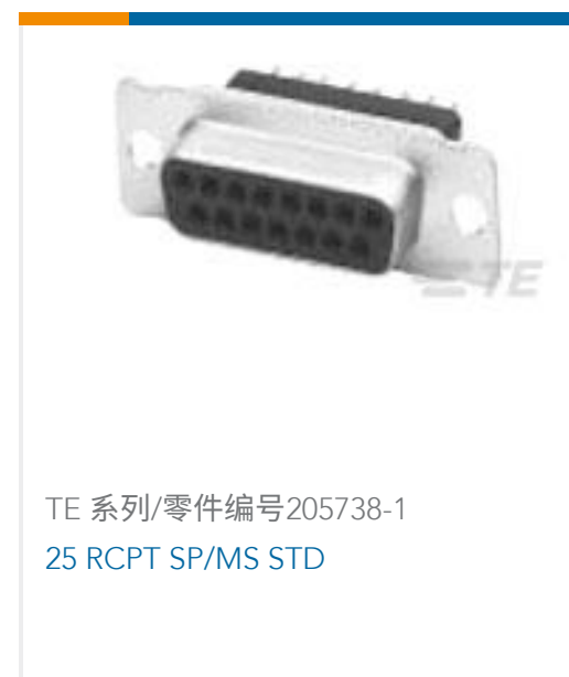
TE 系列/零件编号205738-1 25 RCPT SP/MS STD