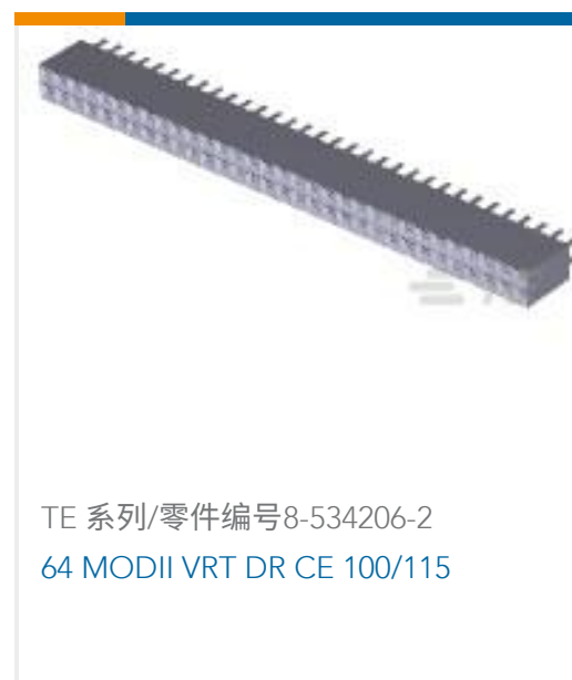
TE 系列/零件编号8-534206-2 64 MODII VRT DR CE 100/115