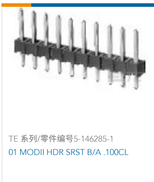
TE 系列/零件编号5-146285-1 01 MODII HDR SRST B/A .100CL