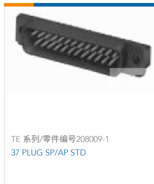
TE 系列/零件编号208009-1 37 PLUG SP/AP STD