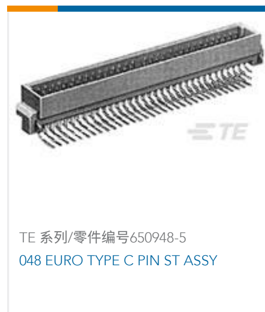
TE 系列/零件编号650948-5 048 EURO TYPE C PIN ST ASSY