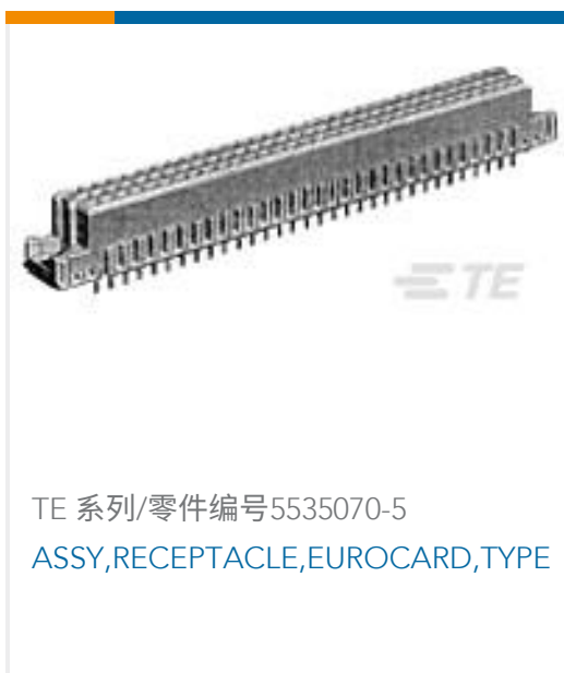
TE 系列/零件编号535070-5 ASSY,RECEPTACLE,EUROCARD,TYPE