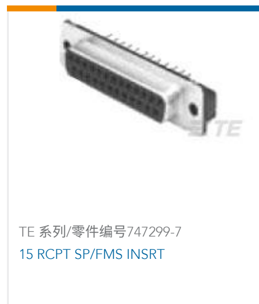
TE 系列/零件编号747299-7 15 RCPT SP/FMS INSRT