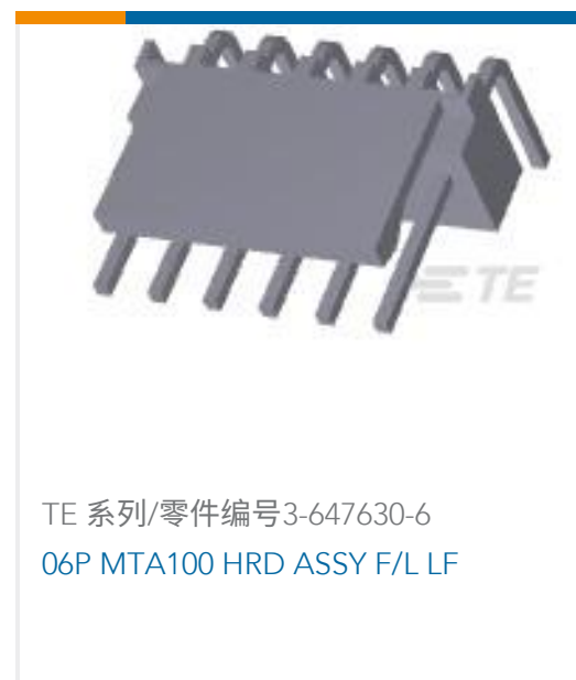
TE 系列/零件编号3-647630-6 06P MTA100 HRD ASSY F/L LF