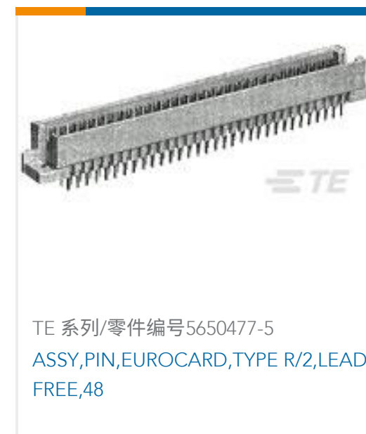
TE 系列/零件编号5650477-5 ASSY,PIN,EUROCARD,TYPE R/2,LEAD-FREE,48