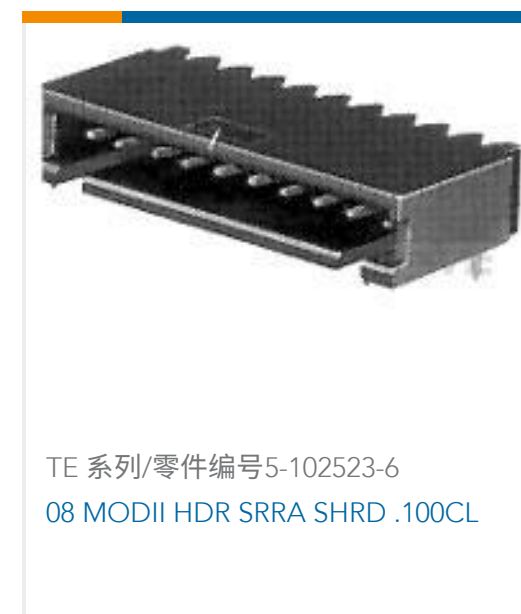
TE 系列/零件编号5-102523-6 08 MODII HDR SRRA SHRD .100CL