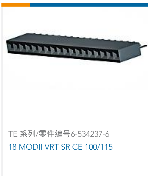
TE 系列/零件编号6-534237-6 18 MODII VRT SR CE 100/115