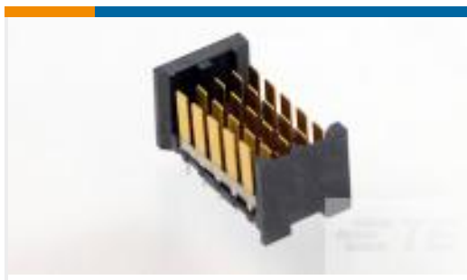
TE 系列/零件编号5120678-2 Z-PACK HS3 HDR ASSY 30P LH