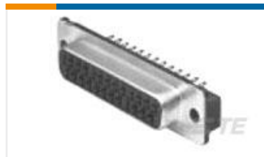
TE 系列/零件编号747142-2 15 RCPT ACT PIN/MS MED SCRLK