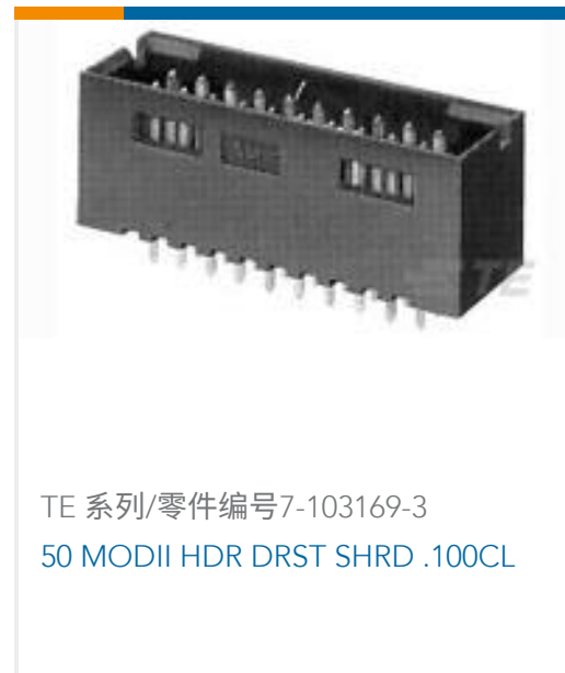
TE 系列/零件编号7-103169-3 50 MODII HDR DRST SHRD .100CL