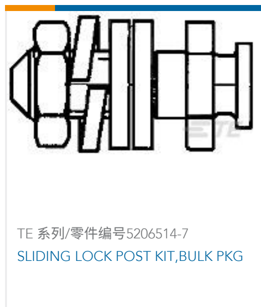
TE 系列/零件编号5206514-7 SLIDING LOCK POST KIT,BULK PKG