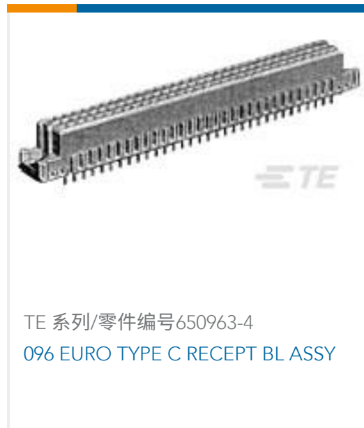
TE 系列/零件编号650963-4 096 EURO TYPE C RECEPT BL ASSY