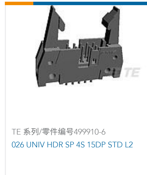
TE 系列/零件编号499910-6 026 UNIV HDR SP 4S 15DP STD L2