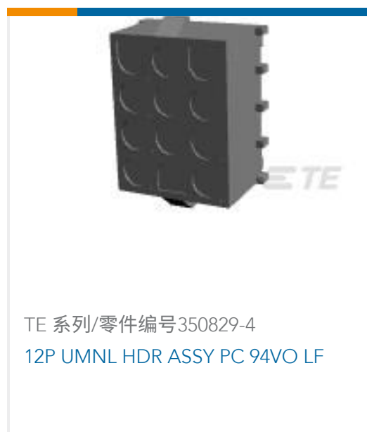
TE 系列/零件编号350829-4 12P UMNL HDR ASSY PC 94VO LF