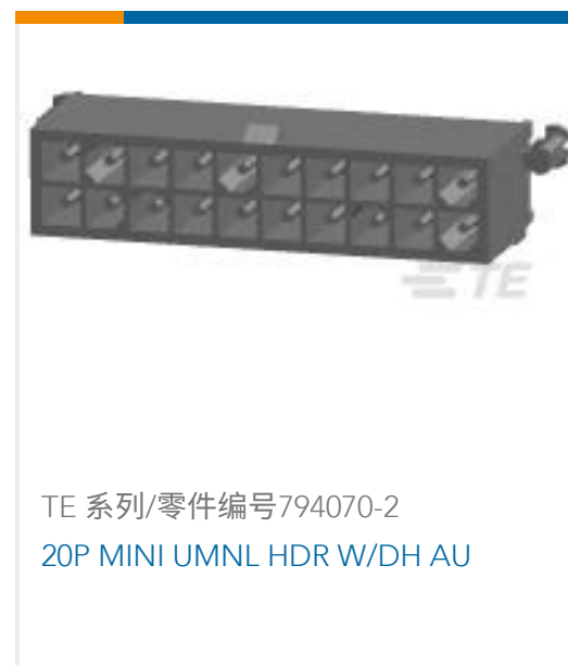
TE 系列/零件编号794070-2 20P MINI UMNL HDR W/DH AU