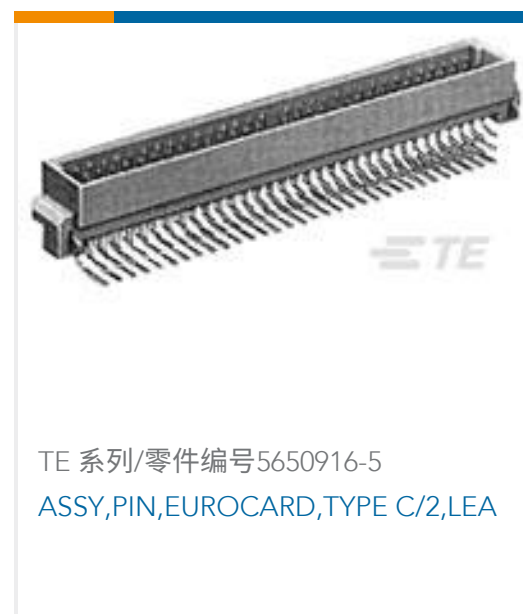
TE 系列/零件编号5650916-5 ASSY,PIN,EUROCARD,TYPE C/2,LEA