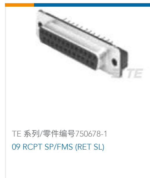
TE 系列/零件编号750678-1 09 RCPT SP/FMS (RET SL)