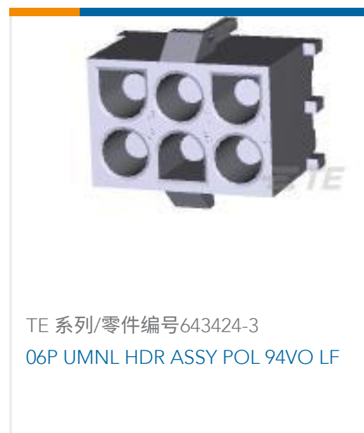
TE 系列/零件编号643424-3 06P UMNL HDR ASSY POL 94VO LF