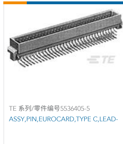
TE 系列/零件编号5536405-5 ASSY,PIN,EUROCARD,TYPE C,LEAD-