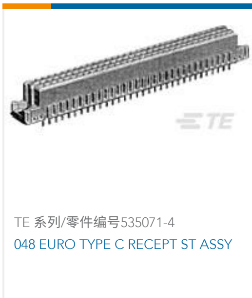
TE 系列/零件编号535071-4 048 EURO TYPE C RECEPT ST ASSY