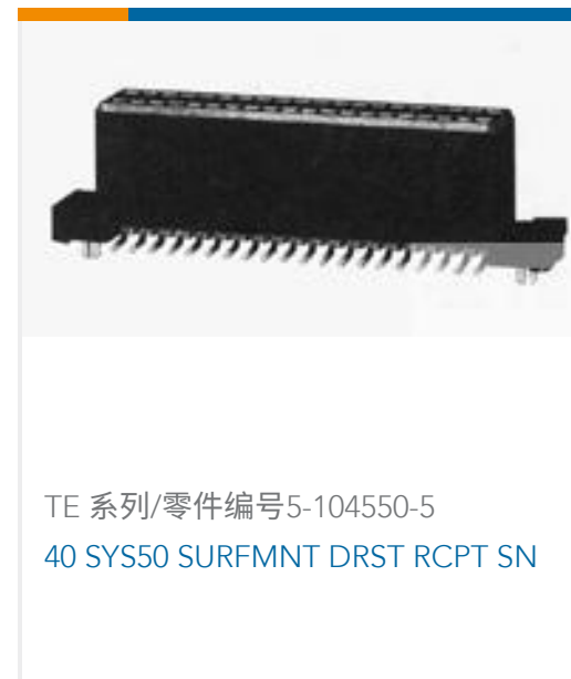
TE 系列/零件编号5-104550-5 40 SYS50 SURFMNT DRST RCPT SN