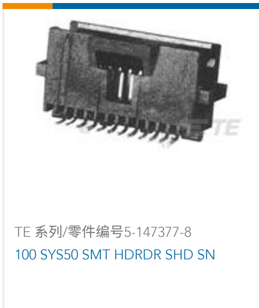
TE 系列/零件编号5-147377-8 100 SYS50 SMT HDRDR SHD SN