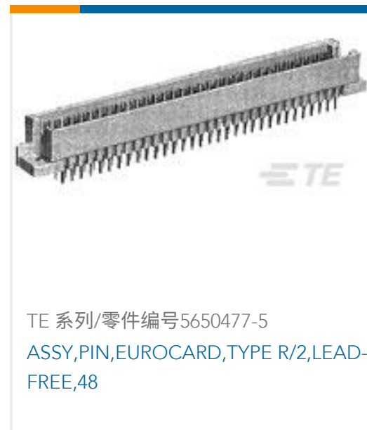
TE 系列/零件编号5650477-5 ASSY,PIN,EUROCARD,TYPE R/2,LEAD-FREE,48