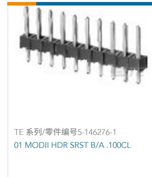
TE 系列/零件编号5-146276-1 01 MODII HDR SRST B/A .100CL