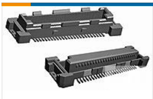
TE 系列/零件编号6473225-1 .6FHP12H,140,S,GIG,08/Sn,ST,NSYes