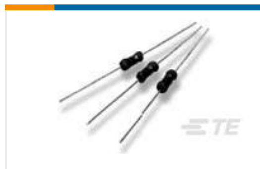
TE 系列/零件编号3-1879350-1 RR01 5% 3R9 AMMO