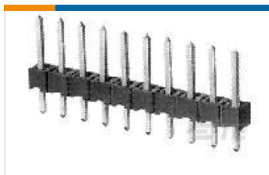
TE 系列/零件编号2-825434-5 25P MOD II BRK AWAY HDR, 0.8AU, 1 ROW