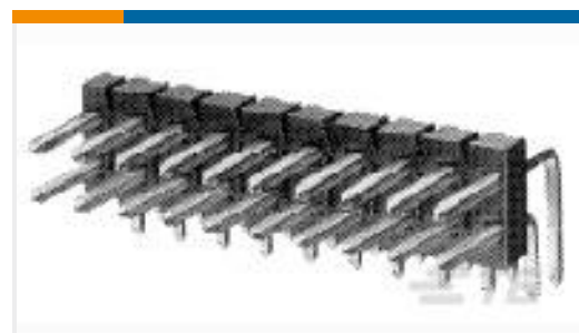
TE 系列/零件编号5-146308-3 06 MOD II HDR DRR A/B/A .100