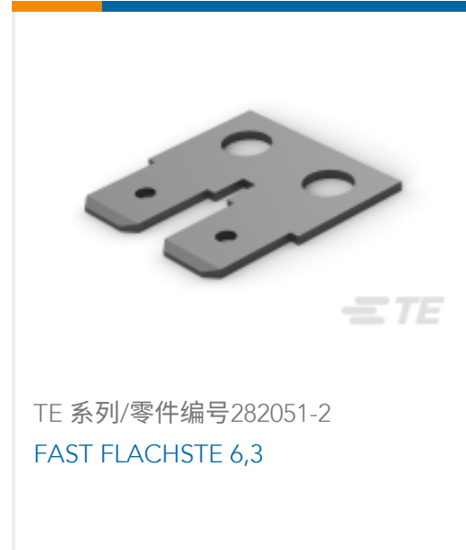
TE 系列/零件编号282051-2 FAST FLACHSTE 6,3