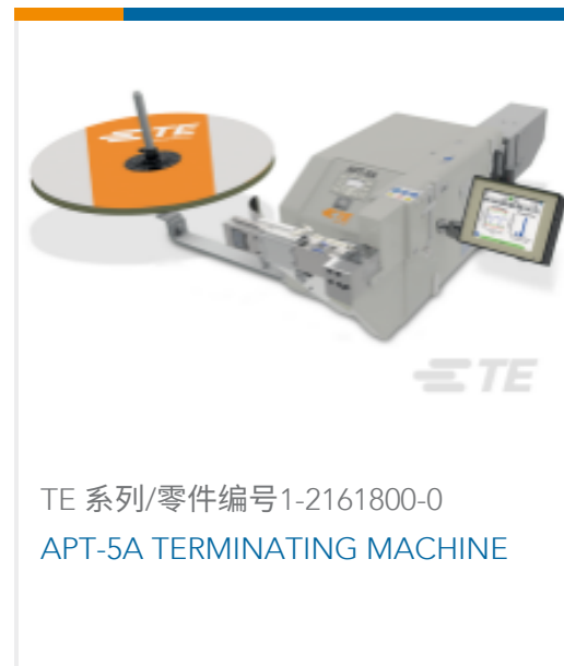
TE 系列/零件编号1-2161800-0 APT-5A TERMINATING MACHINE