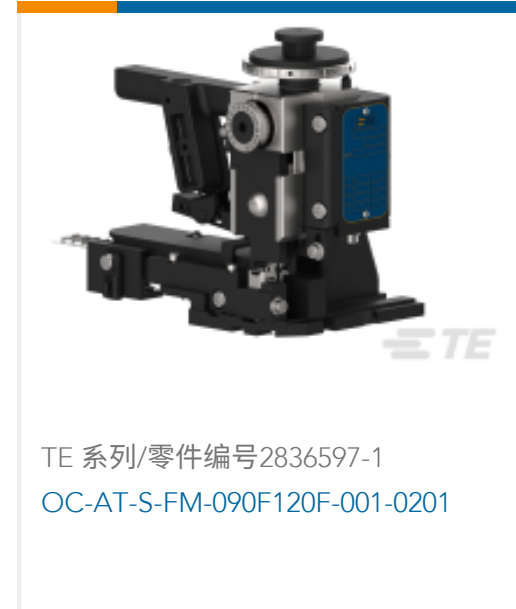
TE 系列/零件编号2836597-1 OC-AT-S-FM-090F120F-001-0201