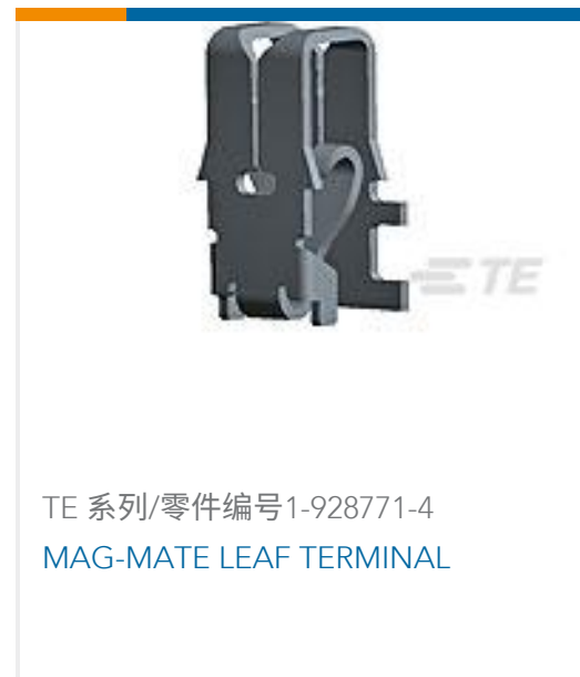
TE 系列/零件编号1-928771-4 MAG-MATE LEAF TERMINAL