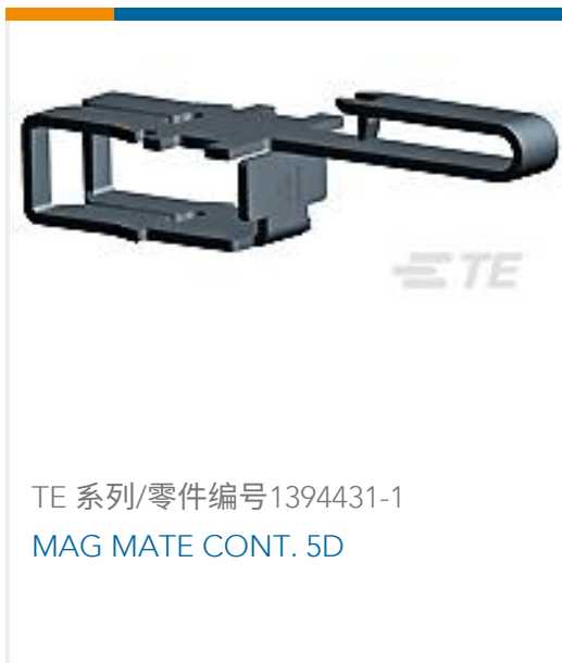
TE 系列/零件编号1394431-1 MAG MATE CONT. 5D