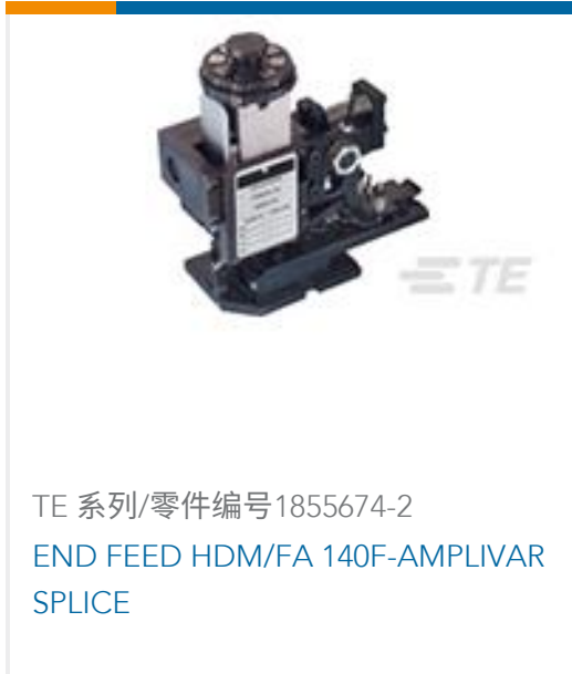
TE 系列/零件编号1855674-2 END FEED HDM/FA 140F-AMPLIVAR SPLICE