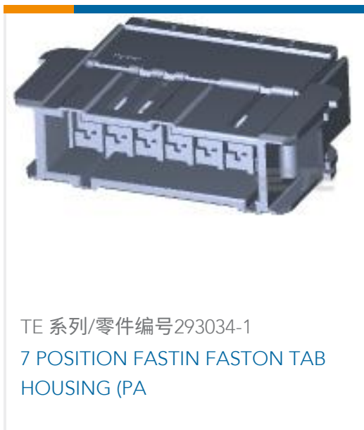
TE 系列/零件编号293034-1 7 POSITION FASTIN FASTON TAB HOUSING (PA)