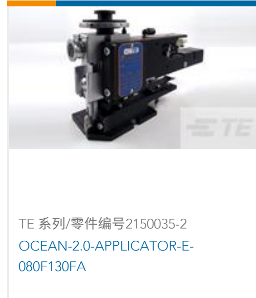
TE 系列/零件编号2150035-2 OCEAN-2.0-APPLICATOR-E- 080F130FA