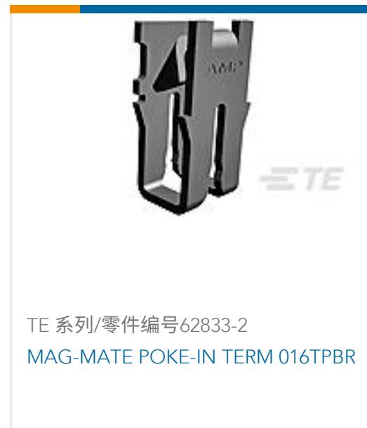
TE 系列/零件编号62833-2 MAG-MATE POKE-IN TERM 016TPBR