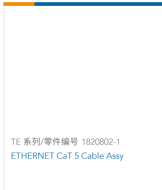
TE 系列/零件编号 1820802-1 ETHERNET CaT 5 Cable Assy