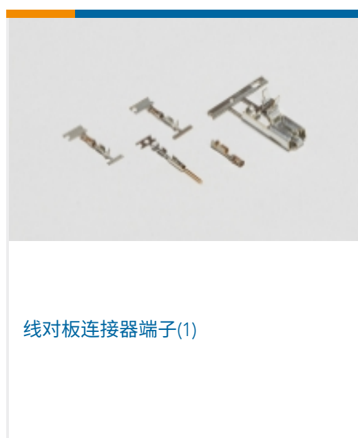
线对板连接器端子(1)