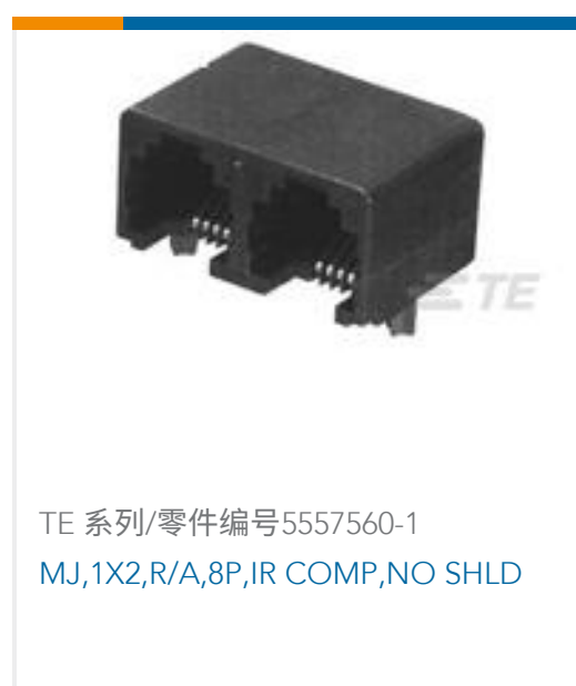
TE 系列/零件编号5557560-1 MJ,1X2,R/A,8P,IR COMP,NO SHLD