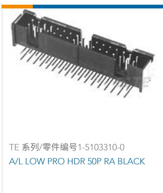
TE 系列/零件编号1-5103310-0 A/L LOW PRO HDR 50P RA BLACK