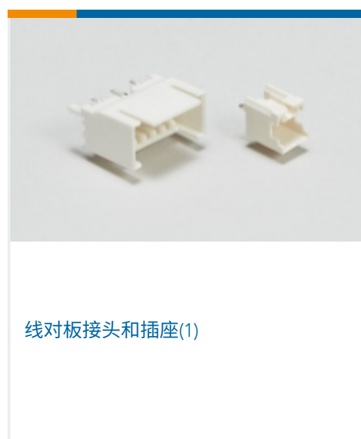
线对板接头和插座(1)