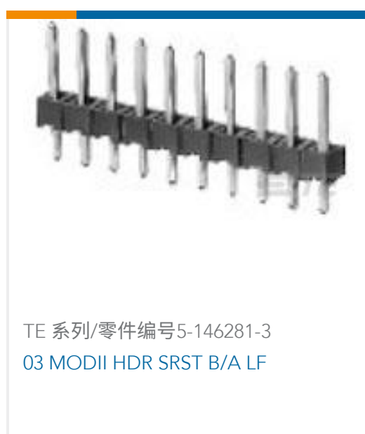
TE 系列/零件编号5-146281-3 03 MODII HDR SRST B/A LF