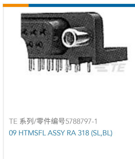
TE 系列/零件编号5788797-1 09 HTMSFL ASSY RA 318 (SL,BL)