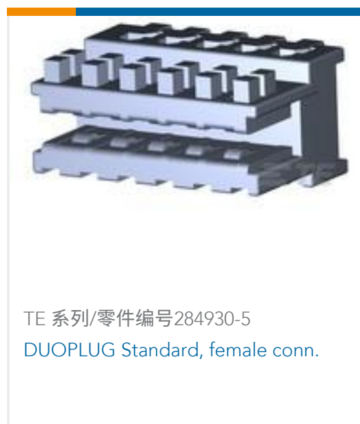
TE 系列/零件编号284930-5 DUOPLUG Standard, female conn.