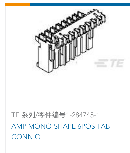
TE 系列/零件编号1-284745-1 AMP MONO-SHAPE 6POS TAB CONN O