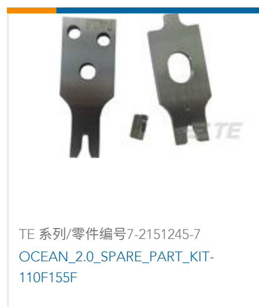
TE 系列/零件编号7-2151245-7 OCEAN_2.0_SPARE_PART_KIT-110F155F