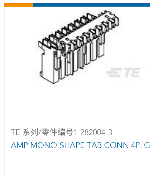
TE 系列/零件编号1-282004-3 AMP MONO-SHAPE TAB CONN 4P. G