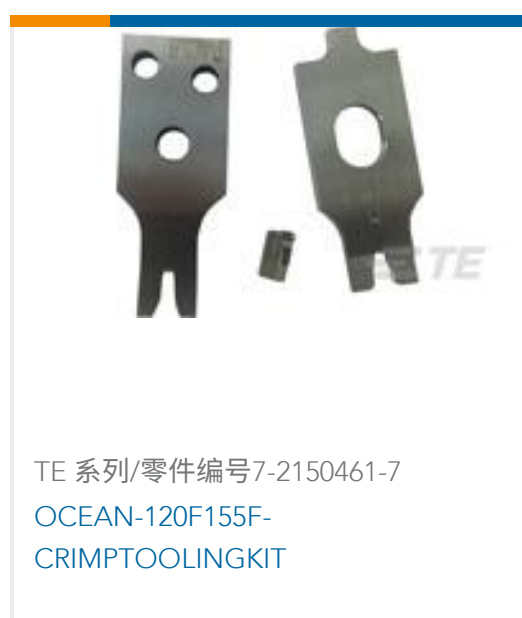
TE 系列/零件编号7-2150461-7 OCEAN-120F155F-CRIMPTOOLINGKIT