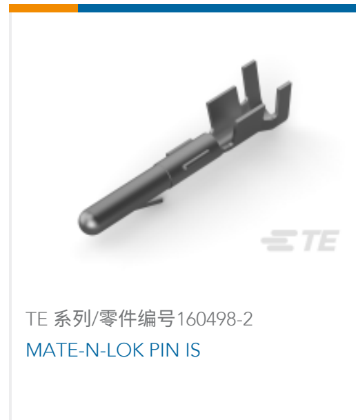
TE 系列/零件编号160498-2 MATE-N-LOK PIN IS