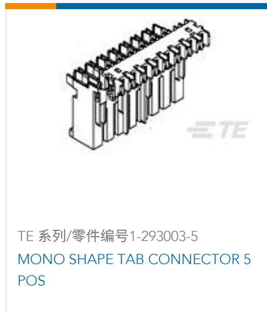
TE 系列/零件编号1-293003-5 MONO SHAPE TAB CONNECTOR 5 POS