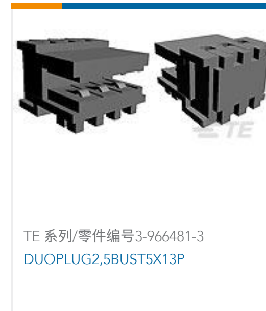
TE 系列/零件编号3-966481-3 DUOPLUG2,5BUST5X13P