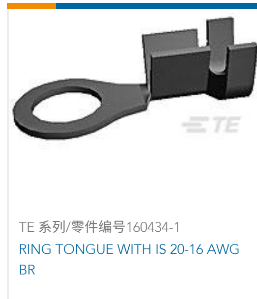
TE 系列/零件编号160434-1 RING TONGUE WITH IS 20-16 AWG BR