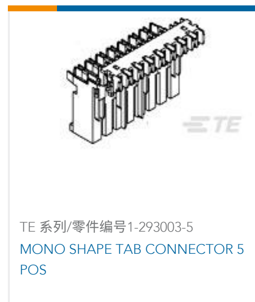
TE 系列/零件编号1-293003-5 MONO SHAPE TAB CONNECTOR 5 POS