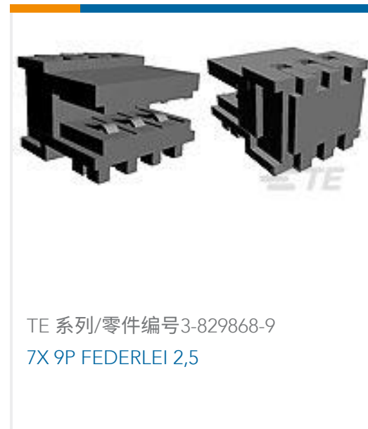
TE 系列/零件编号3-829868-9 7X 9P FEDERLEI 2,5