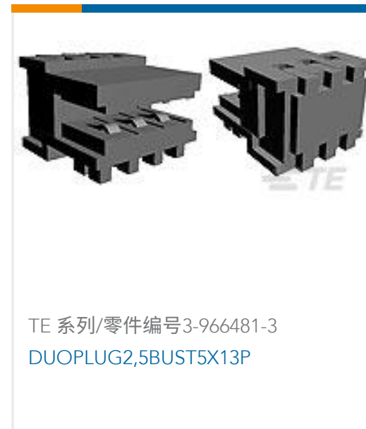
TE 系列/零件编号3-966481-3 DUOPLUG2,5BUST5X13P