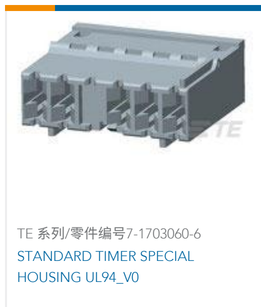
TE 系列/零件编号7-1703060-6 STANDARD TIMER SPECIAL HOUSING UL94_V0