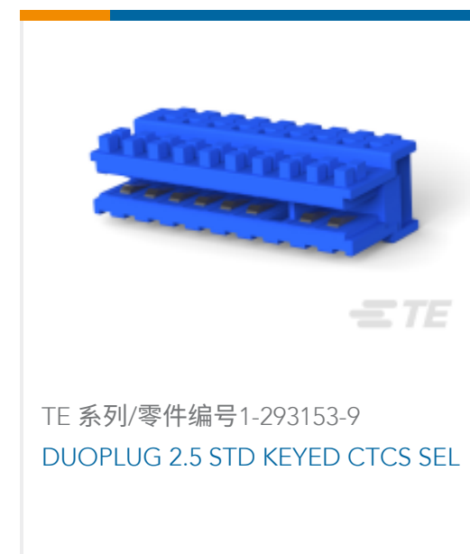
TE 系列/零件编号1-293153-9 DUOPLUG 2.5 STD KEYED CTCS SEL POS