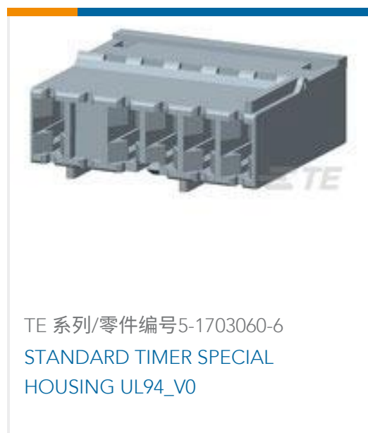
TE 系列/零件编号5-1703060-6 STANDARD TIMER SPECIAL HOUSING UL94_V0