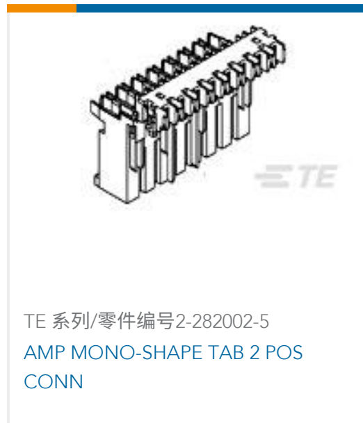
TE 系列/零件编号2-282002-5 AMP MONO-SHAPE TAB 2 POS CONN