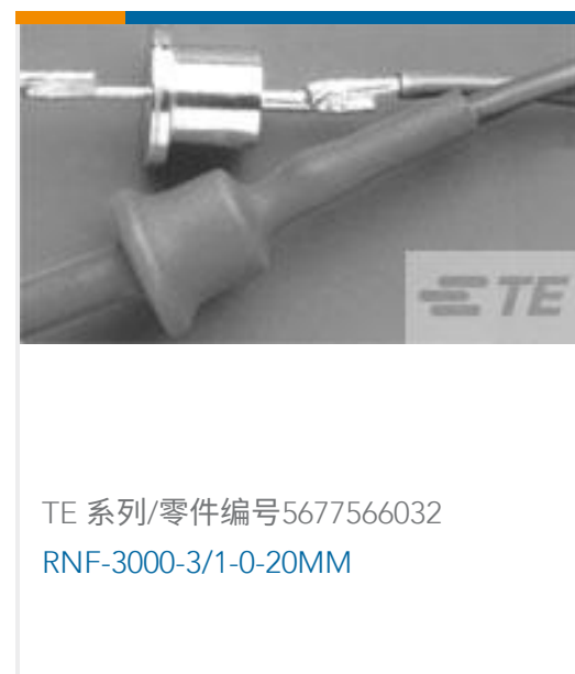
TE 系列/零件编号5677566032 RNF-3000-3/1-0-20MM