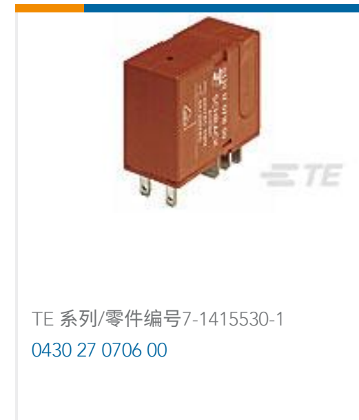
TE 系列/零件编号7-1415530-1 0430 27 0706 00