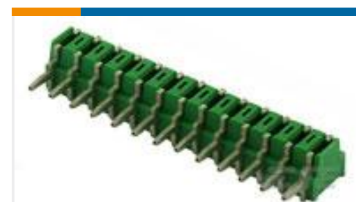
TE 系列/零件编号2-5161800-0 20pos.MINI-MATCH FBTB, 2.5mm pitch