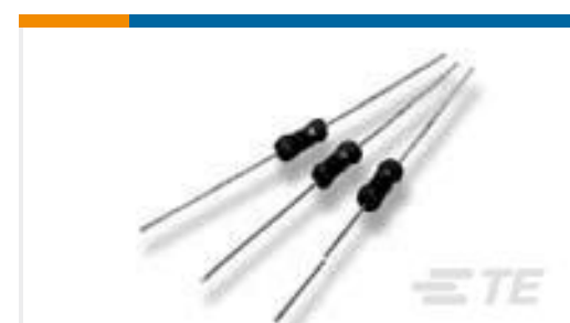
TE 系列/零件编号3-1879350-6 RR01 5% 6R2 AMMO