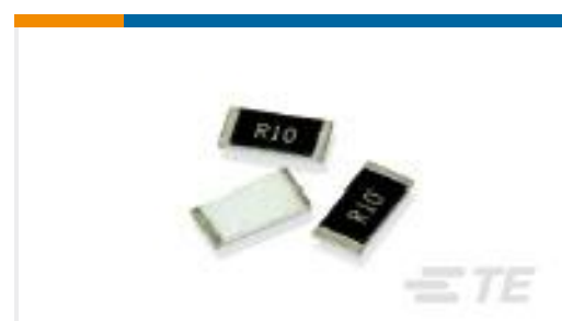
TE 系列/零件编号2-1879464-1 RL73H 2H R82 1% 4K RL