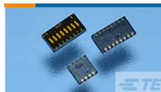
TE 系列/零件编号1977831-5 DIP SWITCH GDH10SATR04