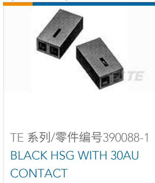
TE 系列/零件编号390088-1 BLACK HSG WITH 30AU CONTACT