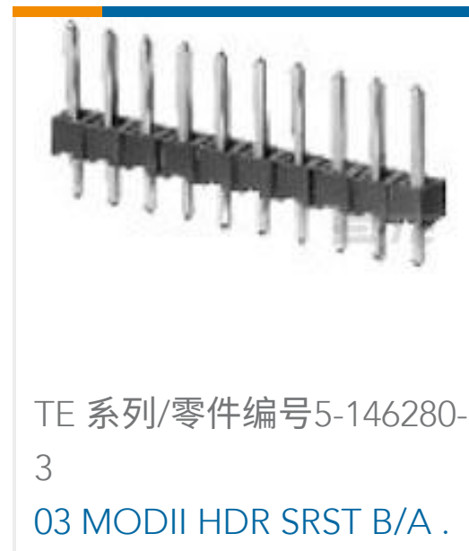
TE 系列/零件编号5-146280- 3 03 MODII HDR SRST B/A . 100CL