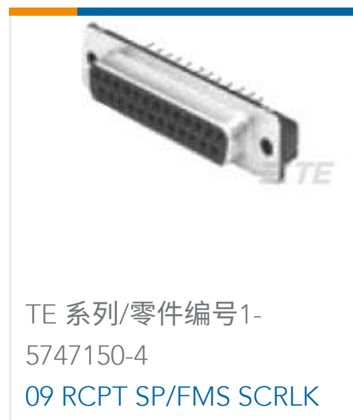
TE 系列/零件编号1- 5747150-4 09 RCPT SP/FMS SCRLK