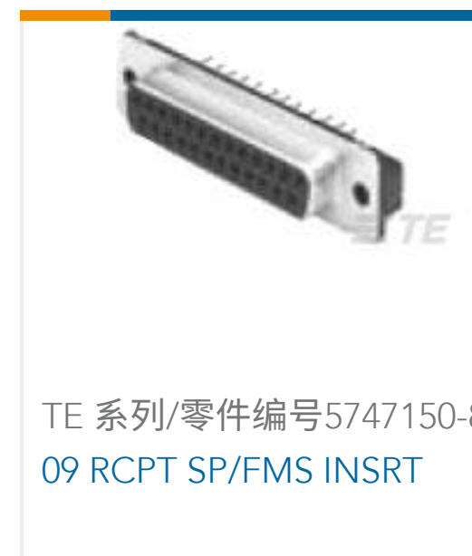
TE 系列/零件编号5747150-8 09 RCPT SP/FMS INSRT