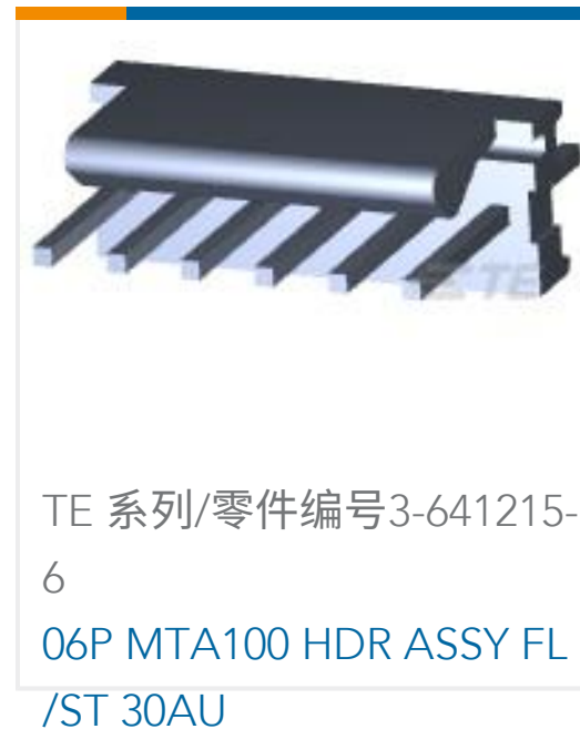
TE 系列/零件编号3-641215- 6 06P MTA100 HDR ASSY FL /ST 30AU