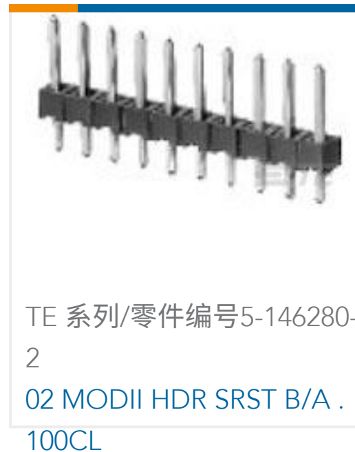
TE 系列/零件编号5-146280- 2 02 MODII HDR SRST B/A . 100CL