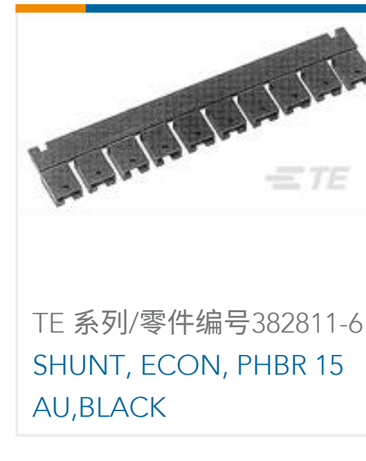
TE 系列/零件编号382811-6 SHUNT, ECON, PHBR 15 AU, BLACK