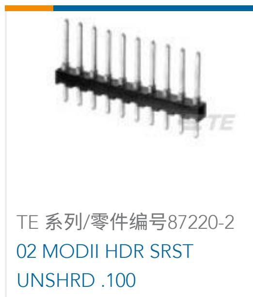
TE 系列/零件编号87220-2 02 MODII HDR SRST UNSHRD .100