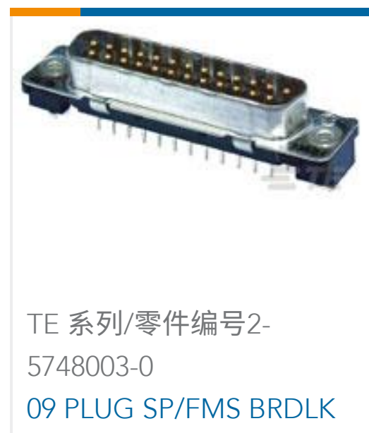
TE 系列/零件编号2- 5748003-0 09 PLUG SP/FMS BRDLK