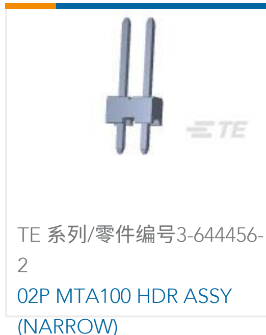
TE 系列/零件编号3-644456- 2 02P MTA100 HDR ASSY (NARROW)