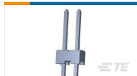
TE 系列/零件编号3-644456- 2 02P MTA100 HDR ASSY (NARROW)