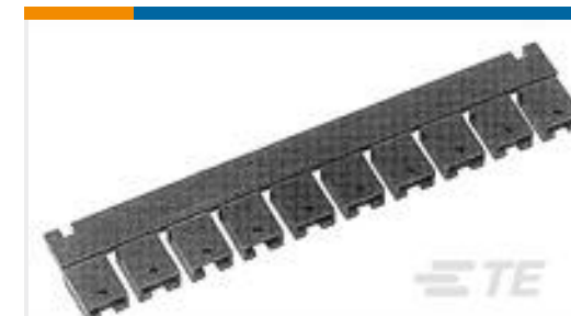
TE 系列/零件编号382811-8 SHUNT, ECON, PHBR 5AU, BLACK