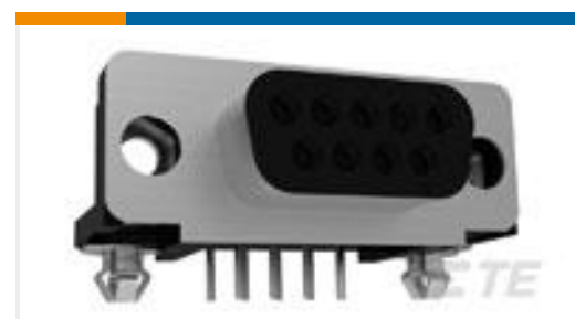
TE 系列/零件编号5747844-4 09 MSFL RCPT RA 318 (IN, FM,BL)