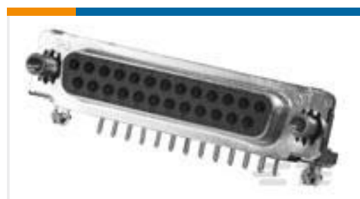
TE 系列/零件编号5745781-4 09 MSFL RCPT RA 318 (IN, FM)