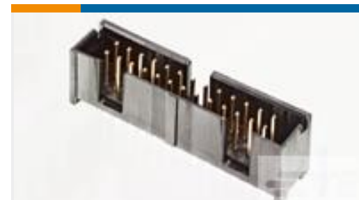
TE 系列/零件编号5103308-5 A/L LOW PRO HDR 20P VERT BLACK