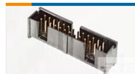
TE 系列/零件编号5103308-1 A/L LOW PRO HDR 10P VERT BLACK