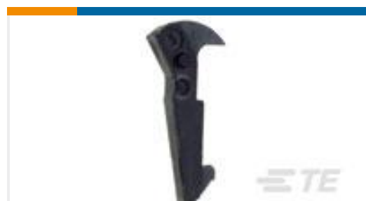
TE 系列/零件编号102320-1 UNIVERSAL HEADER LATCH