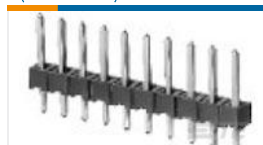
TE 系列/零件编号5-146280- 3 03 MODII HDR SRST B/A . 100CL