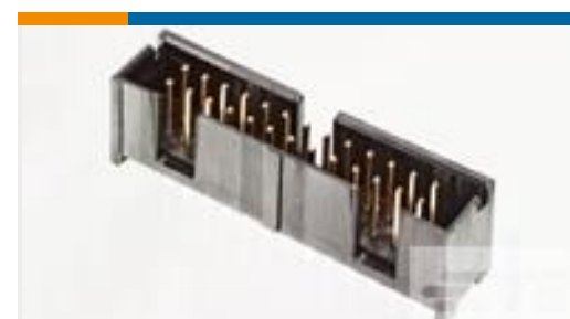
TE 系列/零件编号5103309-1 A/L LOW PRO HDR 10P VERT BLACK