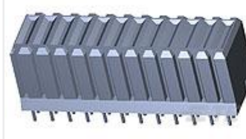
TE 系列/零件编号5223995-2 UPM EXPANDED RECEPTACLE ASSEMB