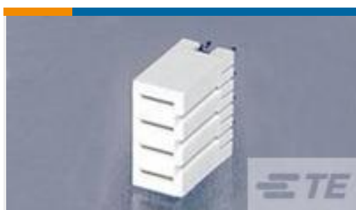
TE 系列/零件编号1903978-1 POWER MODULE 4POS. REC. ASSY,