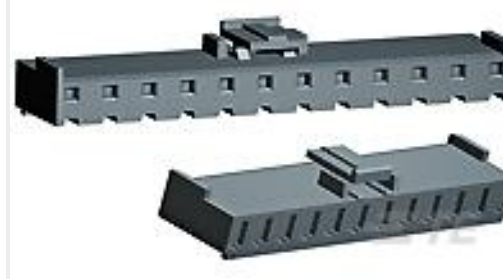
TE 系列/零件编号1744036-3 03P ECONOMY POWER . 200 CL HSG