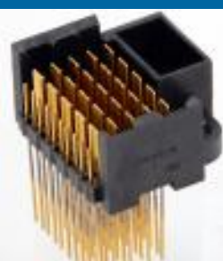
TE 系列/零件编号5120674-1 Z-PACK HS3 HDR ASSY 6R 60P