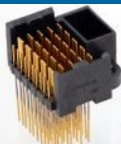
TE 系列/零件编号5120658-1 Z-PACK HS3 HDR ASY 10R 100P