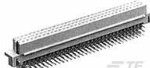
TE 系列/零件编号5650895-4 ASSY,RECEPT,EUROCARD, TYPE R,LE