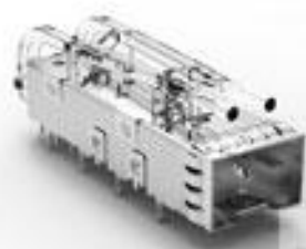
TE 系列/零件编号2007254-1 SFP+ 1x1 Cage Assembly, Light Pipe