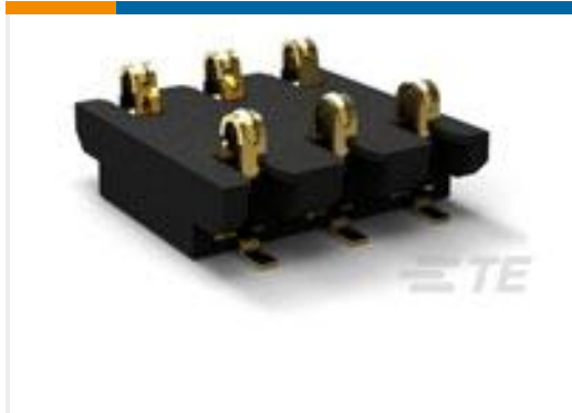
TE 系列/零件编号 1932771-1 6 pins 1.6P 1.65H BtoB connector