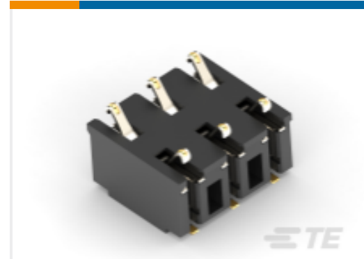
TE 系列/零件编号 2199064-2 TAP 6 POS 2.0PITCH 3.15H