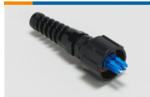
ODVA LC 连接器(3)