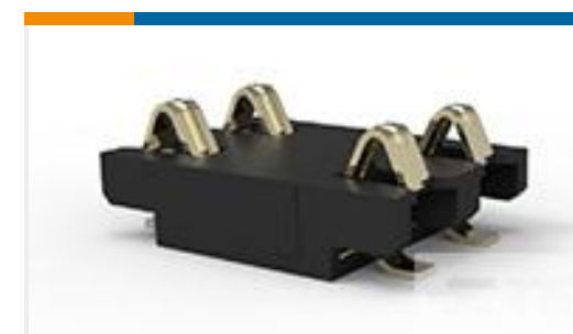
TE 系列/零件编号2199172-1 4 pins 1.6P 1.4H BtoB connector