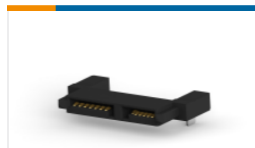
TE 系列/零件编号1-1735413-1 Assembly Slimline SATA Receptacle 7P+6P