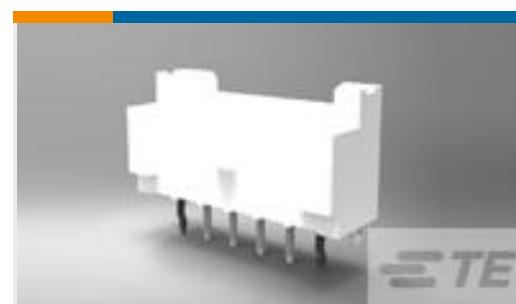
TE 系列/零件编号1744439-5 EP2.5 Shrd HDR ASSY 5P VERT, GW