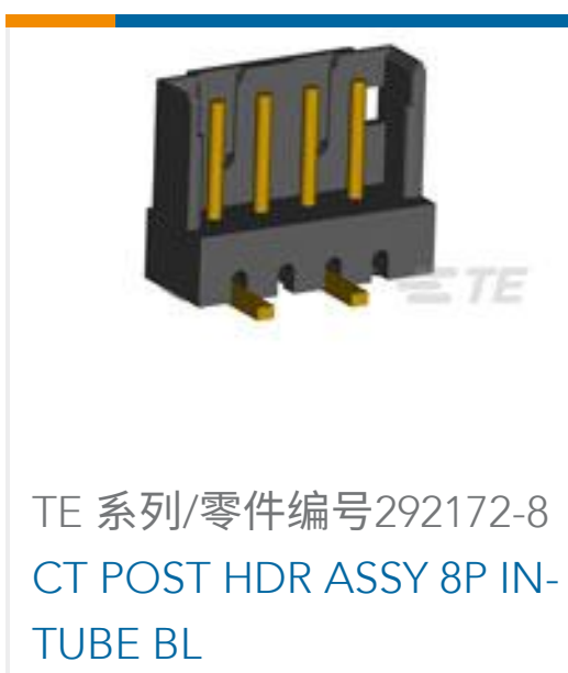
TE 系列/零件编号292172-8 CT POST HDR ASSY 8P IN- TUBE BL