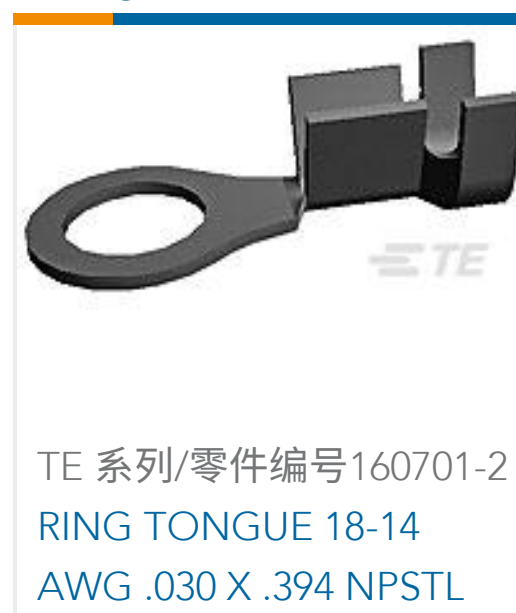
TE 系列/零件编号160701-2 RING TONGUE 18-14 AWG .030 X .394 NPSTL