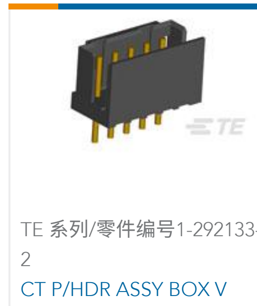
TE 系列/零件编号1-292133-2 CT P/HDR ASSY BOX V 12P W/O KI