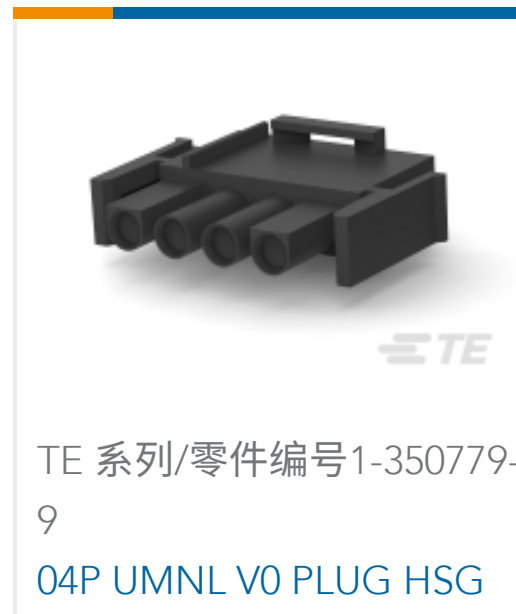
TE 系列/零件编号1-350779-9 04P UMNL V0 PLUG HSG BLACK