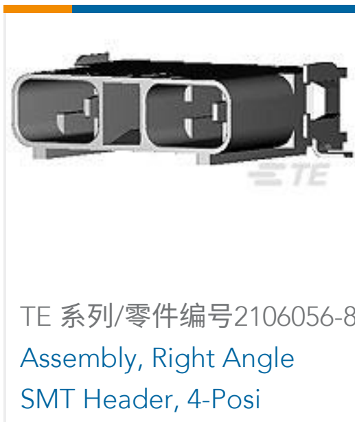
TE 系列/零件编号2106056-8 Assembly, Right Angle SMT Header, 4-Posi