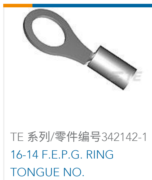
TE 系列/零件编号342142-1 16-14 F.E.P.G. RING TONGUE NO.