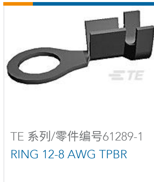
TE 系列/零件编号61289-1 RING 12-8 AWG TPBR