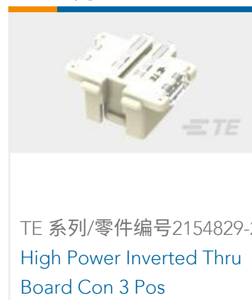
TE 系列/零件编号2154829-2 High Power Inverted Thru Board Con 3 Pos