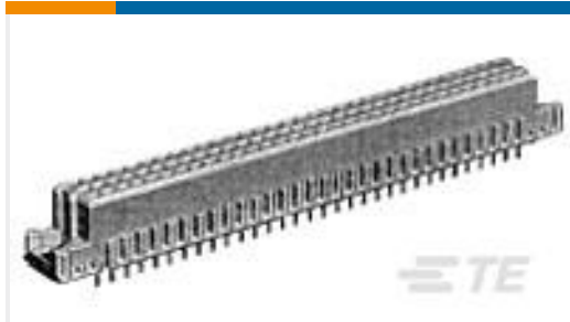
TE 系列/零件编号5650406-5 ASSEMBLY,RECEPTACLE, EUROCARD,T