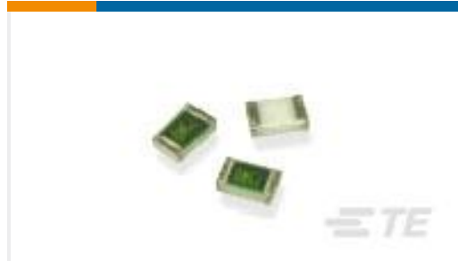
TE 系列/零件编号6-1625867-1 RP 1J 0.166W 26R1 0.1% 25PPM 1K RL