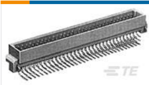
TE 系列/零件编号5650907-5 ASSY,PIN,EUROCARD, TYPE C,LEAD-FREE,150 P