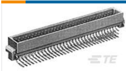
TE 系列/零件编号650907-5 150 EURO TYPE C PIN ST ASSY