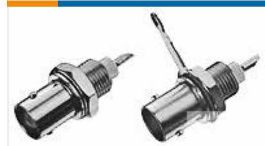
TE 系列/零件编号227755-1 BNC SOLDER RECEPT JACK SHORT