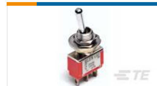
TE 系列/零件编号4-1825136-9 A101SYZQ04