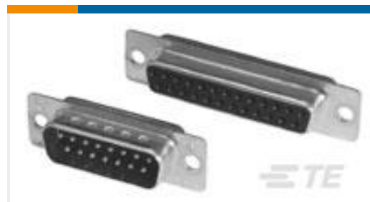
TE 系列/零件编号5-747913-2 25 Rcpt Solder Cup, Gold Flash