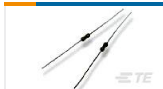
TE 系列/零件编号1-1623708-2 RGP0207CH 10% 1G0