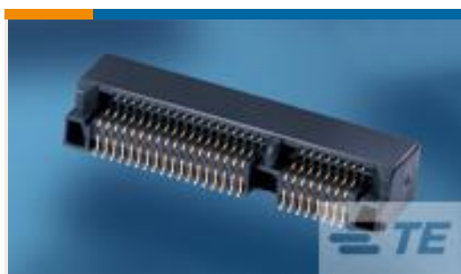
TE 零件编号1775862-2 mSATA/mini PCI-E 5.2H Type I G/F