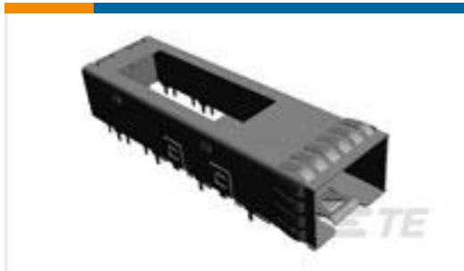
TE 零件编号2110304-1 SFP+ 1x1 Cage Assembly, Solder Tail