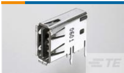
TE 零件编号1-1734775-1 Std USB Type A, Flag, T/H, 1.8A