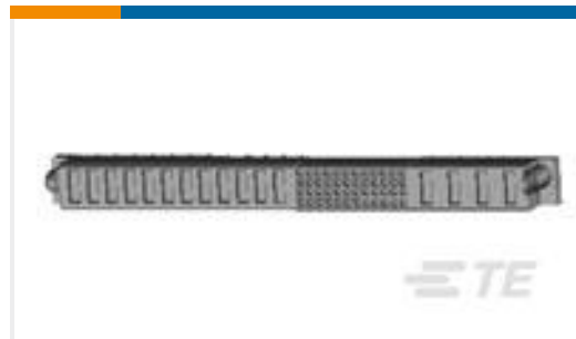
TE 零件编号6450863-5 MBXLE VERT RCPT 7ACP