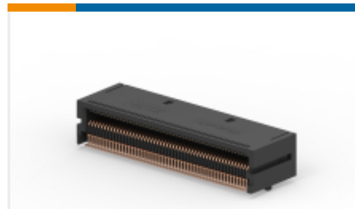
TE 零件编号2274845-1 CFP2 RECEPTACLE ASSEMBLY