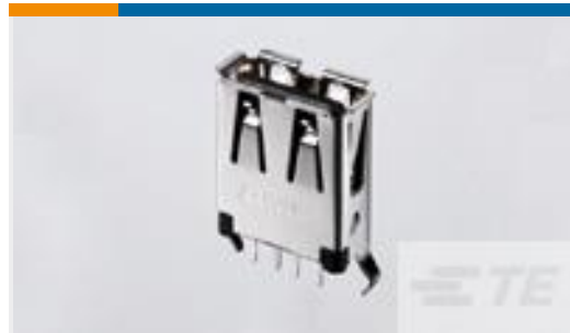
TE 零件编号1734366-3 Std USB Type A, VT, T/H, Blue