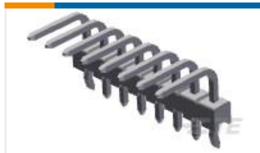
TE 零件编号3-644694-8 08P MTA100 R/A HDR RETENTIVE