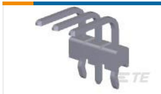
TE 零件编号3-644694-3 03P MTA100 R/A HDR RETENTIVE