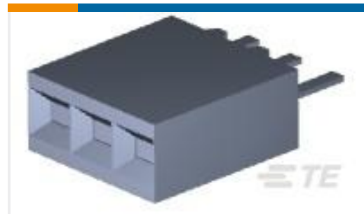
TE 零件编号5-146138-1 03 MODIV VRT SR CE 100 /115