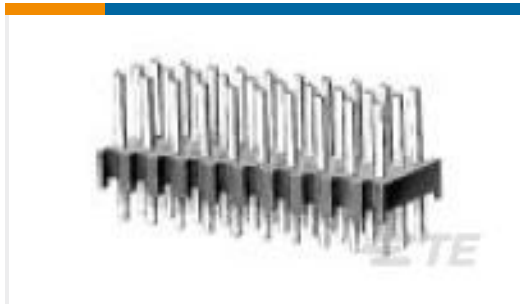
TE 零件编号3-829492-6 3X36P MOD2 STIFTLI