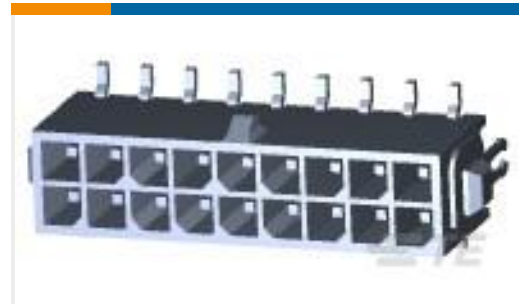
TE 零件编号4-794634-8 18P MICRO MNL ASSY, VRT,SMT LF