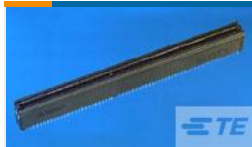
TE 零件编号5145251-3 AMP 1MM STD EDGE 242 POS