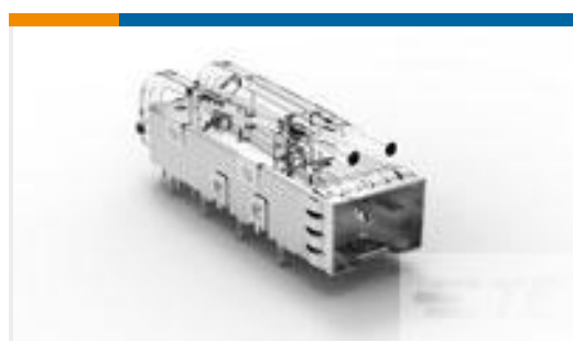
TE 零件编号2007254-1 SFP+ 1x1 Cage Assembly, Light Pipe