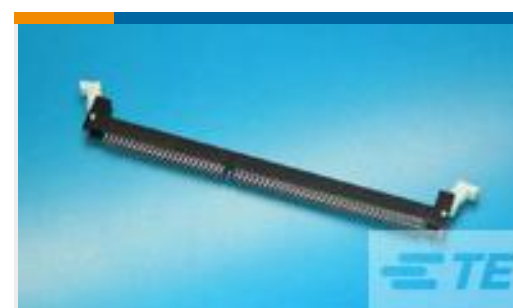
TE 零件编号1-1932000-1 VERTICAL DDR3 DIMM, 240 POSITION