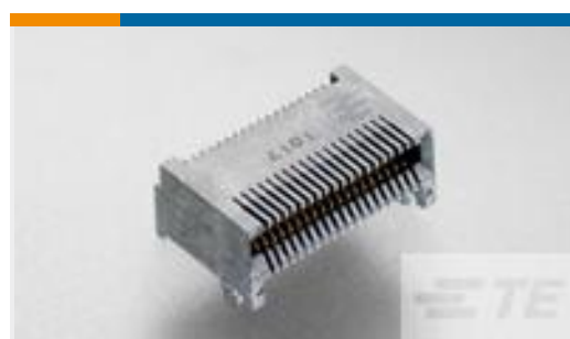
TE 零件编号2110819-1 QSFP+ Enh EVERCLEAR PT Conn