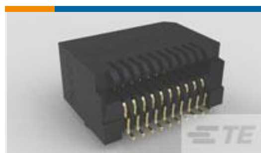
TE 零件编号1658197-1 SFP, 20 POSN, 0.8MM PITCH, SUR