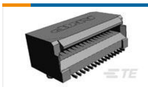
TE 零件编号1367500-1 30 POSN XFP CONN, ENHANCED