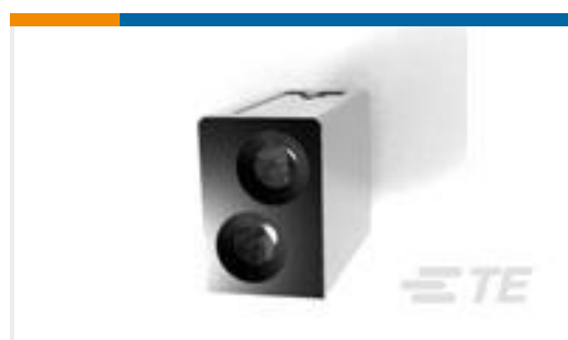
TE 零件编号1-1469373-1 ATCA GUIDE MODULE RA FEMALE