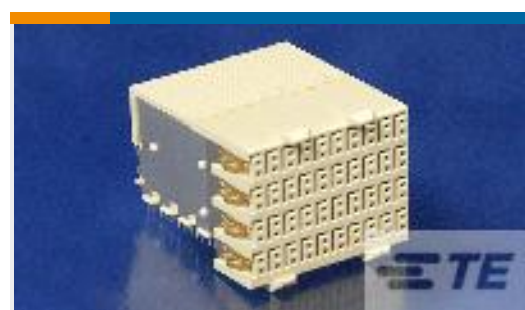
TE 零件编号1469001-1 HM-ZD 4PR RECP 80P