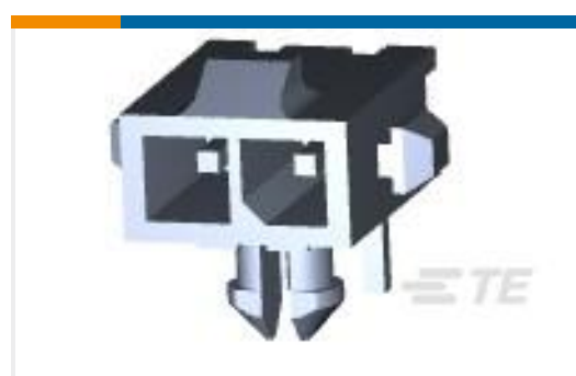
TE 零件编号2-1445089-2 MICRO MNL HDR ASSY S /ROW AU LF