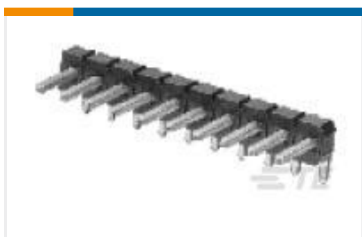
TE 零件编号6-103765-4 14 MODII HD SRRA B/A . 100CL,LF