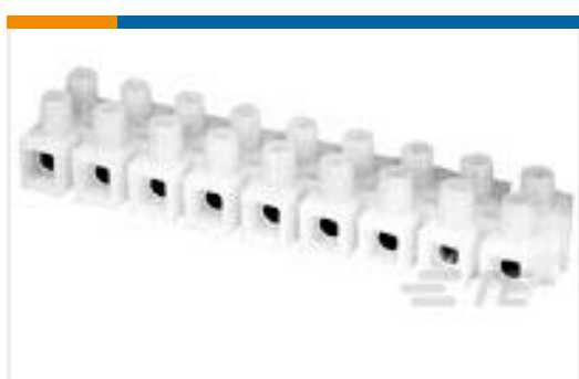
TE 零件编号1776312-2 TSB200002=EUROPA TM-BLK,14.5MM