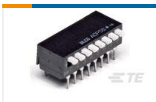
TE 零件编号1-1571999-9 ADP06STR04=PIANO DIP SWITCH