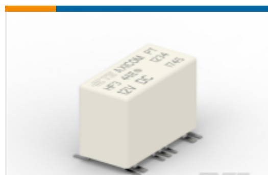
TE 零件编号3-1462050-6 HF3 46E=75 OHM 300MW 12V bi 2c