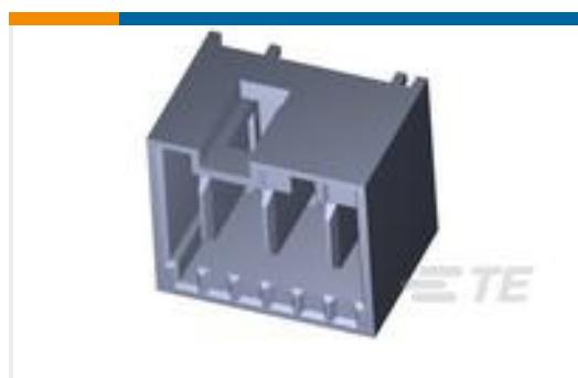
TE 零件编号3-1971846-3 3P, RAST 5 Tab Header, THV