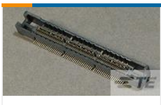
TE 零件编号767114-3 MICT,REC,114,ASY,.025, TAPE,CAP