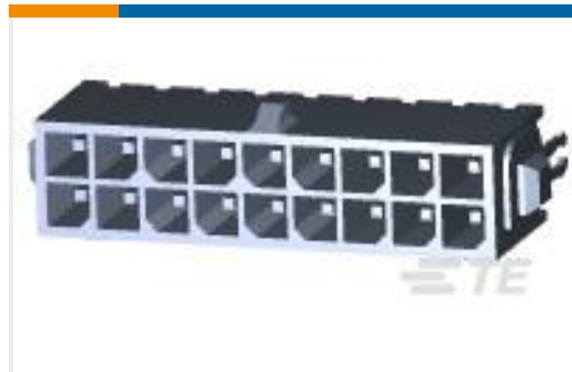
TE 零件编号4-794682-8 18P MICRO MNL ASSY, VRT,THRU,L