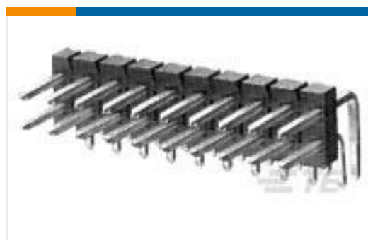
TE 零件编号1-103149-7 34 MODII HDR DRRA B/A . 100CL