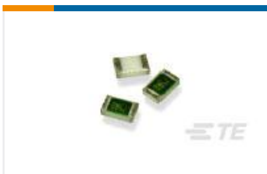
TE 零件编号7-1879212-0 CPF 0402 11R8 0.1% 25PPM 1K RL