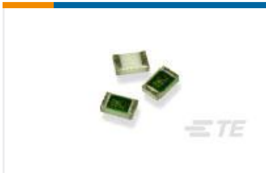
TE 零件编号5-1879213-8 CPF 0402 107R 0.1% 25PPM 1K RL