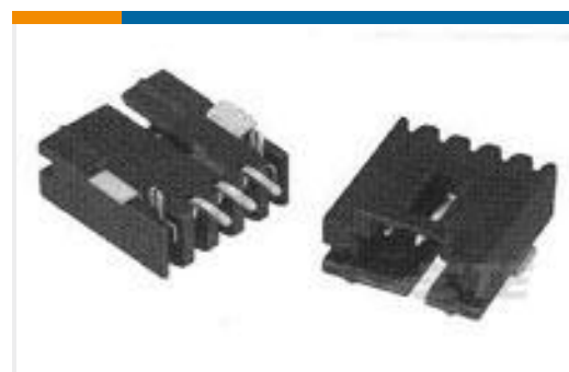
TE 零件编号5-147323-2 03 MTE HDR SRRA SMT. 100CL