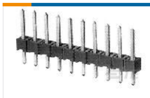
TE 零件编号103747-1 01 MODII HDR SRST B/A . 100CL