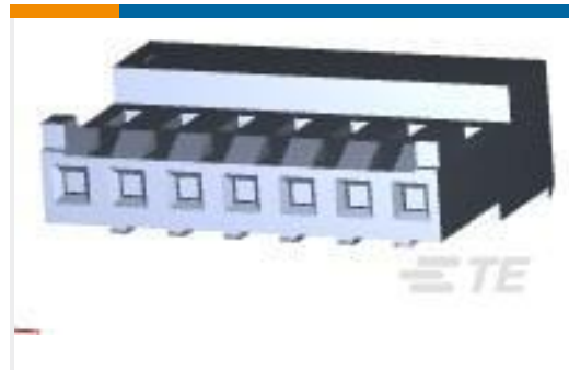
TE 零件编号3-643820-7 07P MTA156 CONN ASSY 24AWG LF