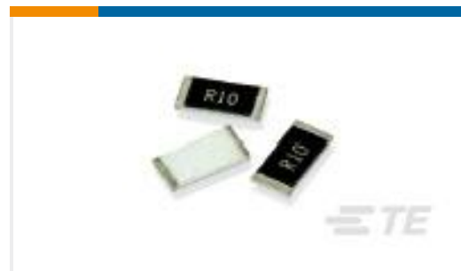
TE 零件编号2-1879460-5 RL73N 1J R10 1% 1K RL