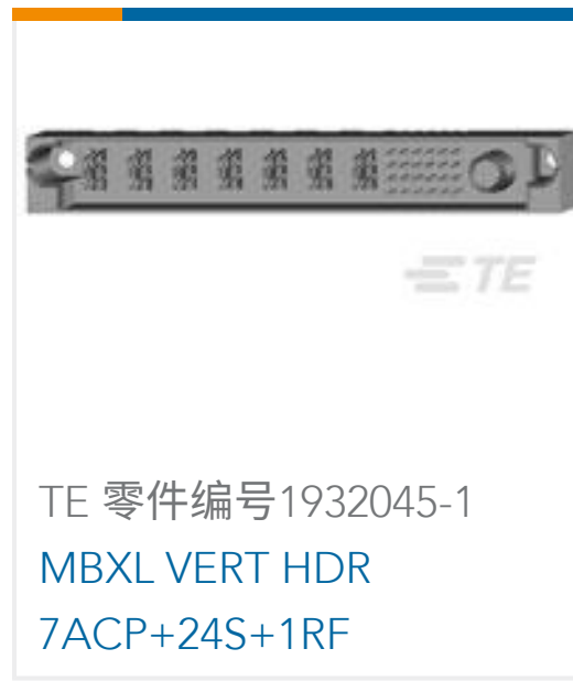
TE 零件编号1932045-1 MBXL VERT HDR 7ACP+24S+1RF