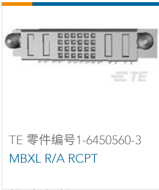
TE 零件编号1-6450560-3 MBXL R/A RCPT