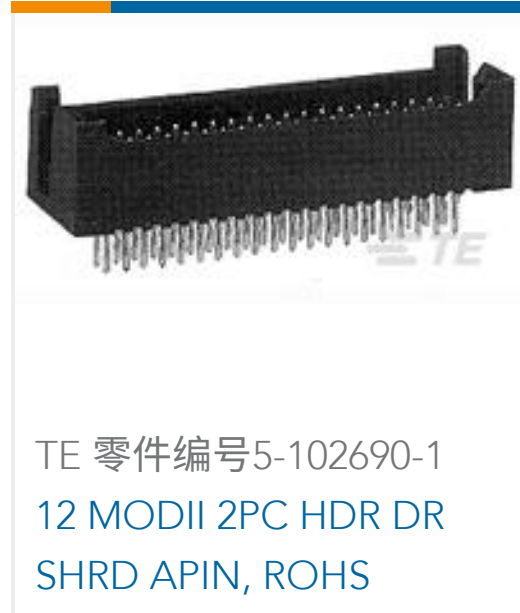
TE 零件编号5-102690-1 12 MODII 2PC HDR DR SHRD APIN, ROHS