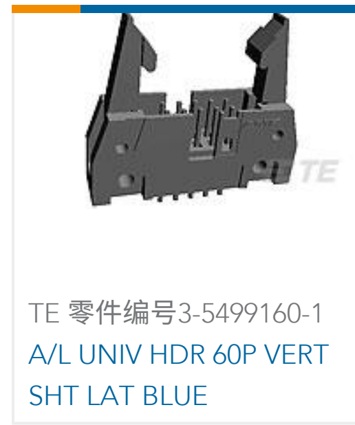
TE 零件编号3-5499160-1 A/L UNIV HDR 60P VERT SHT LAT BLUE