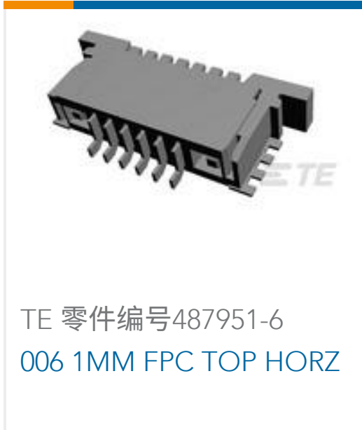
TE 零件编号487951-6 006 1MM FPC TOP HORZ