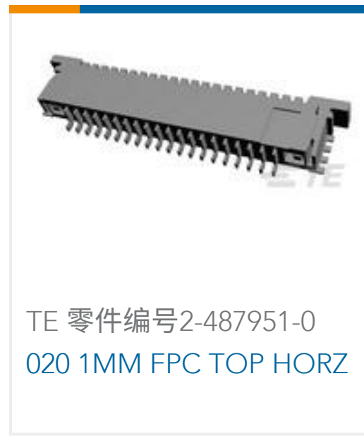
TE 零件编号2-487951-0 020 1MM FPC TOP HORZ